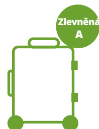
Rozměr nad 20 x 30 x 50 cm